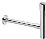
Ozdobny syfon umywalkowy